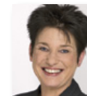
Katrin Altpeter Sozialministerin Baden-Württemberg Moderation: Ines Nößler , EFAS e.V.

16.00 Uhr PASSIV-AKTIV-TRANSFER in Baden-Württemberg – das Landesprogramm zur Arbeitsmarktpolitik auf dem Weg nach Berlin Impuls von und Gespräch mit