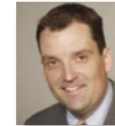
Stefan Küpper Bildungswerk der Baden-Württembergischen Wirtschaft e.V.

14.00 Uhr Öffentlich geförderte Beschäftigung mit PASSIV-AKTIV-TRANSFER ermöglichen Sichtweise der Arbeitgeberverbände